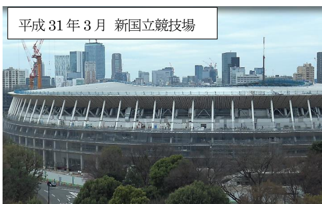
平成 31 年 3 月 新国立競技場