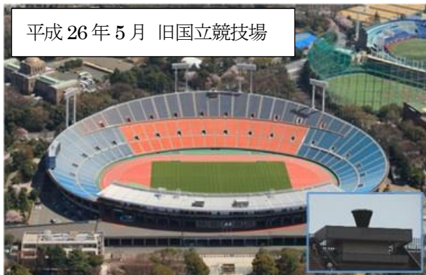
平成 26 年 5 月 旧国立競技場