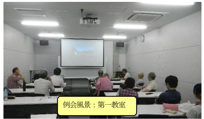
例会風景：第一教室

開催時刻はいずれも13:30からですが、早めに来場して会場準備等に協力をお願いします。